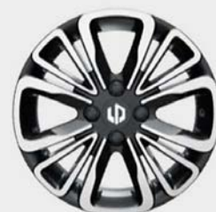
15" hliníkové disky kol