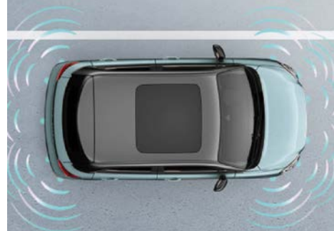
Parkovací senzory & couvací kamera