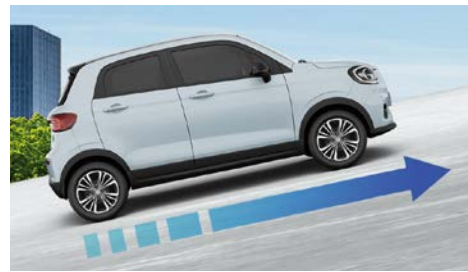
Funkce Autohold (udržení ve svahu)