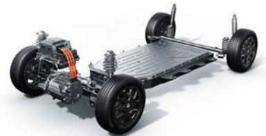
Umístění trakční baterie v podlaze vozu