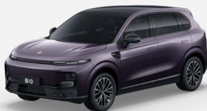
Fialová DAWN (0UB) 18 000 Kč