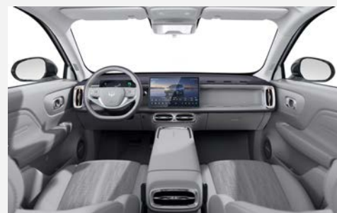
ECO kůže světle šedá (OJS)