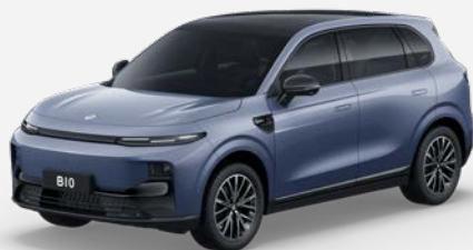
Modrá STARRY NIGHT (0XC) V CENĚ