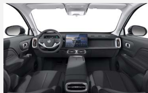
ECO kůže tmavě šedá (OWL)