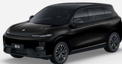
Černá METALLIC (0KL) 18 000 Kč