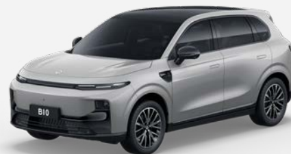
Šedá TUNDRA (0GD) 18 000 Kč