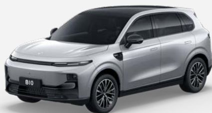
Stříbrná GALAXY (0DS) 18 000 Kč