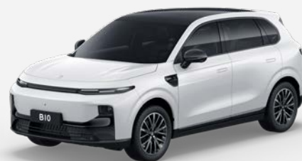
Bílá PEARLY (0AC) 18 000 Kč