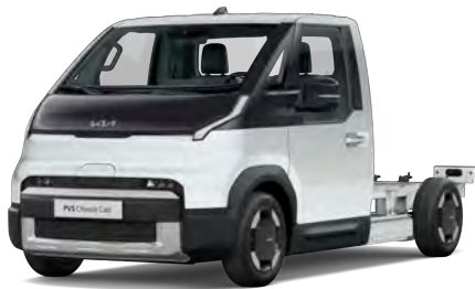
Perleťová bílá Snow (SWP)