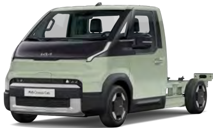
Zelená Mint (SML)