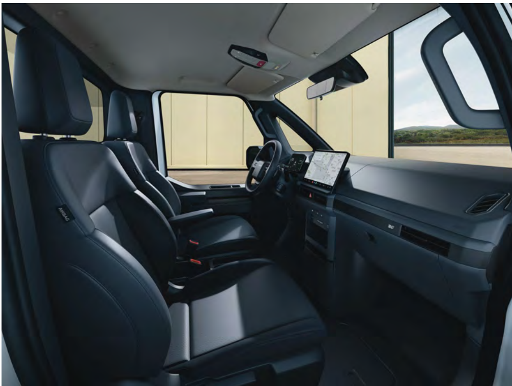
Provedení interiéru Modrá Navy