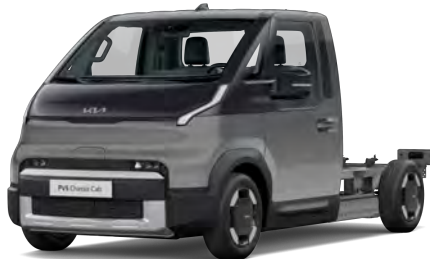
Šedá Steel (KLG)