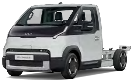
Bílá Clear (UD) bez příplatku