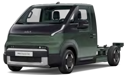
Zelená Cityscape (CGE)