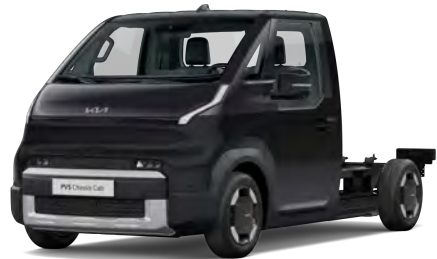
Perleťově černá Aurora (ABP)